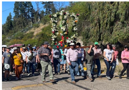
Fiesta San Judas Tadeo

La devoción a San Judas Tadeo llegó a Malloa en el año 1887. La comunidad celebra la fiesta de San Judas Tadeo el 28 de octubre; esta celebración dura un mes completo, desde el 29 de septiembre hasta el 28 de octubre. El 29 de septiembre la imagen del Santo empieza a recorrer las comunidades de la parroquia, permaneciendo dos o tres días en cada una de ellas. El día 20 de octubre se traslada a la parroquia de Malloa. El 28 de octubre, día oficial de la fiesta, se celebran misas desde las 7 de la mañana y a las 5 de la tarde se sale en procesión por el pueblo portando el cuadro de San Judas (Servicio Nacional de Turismo, 2012).