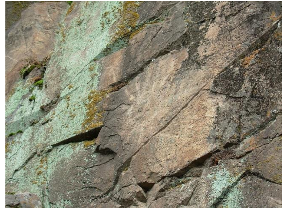
Cerro Sol Pintado

La primera información histórica surge en el año 1461, con la primera invasión inca, del cual queda un importante vestigio, como son los siete soles pintados, que se encuentran al costado sur oriente del cerro (Servicio Nacional de Turismo, 2012).