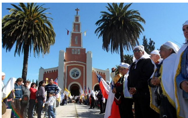
Fiesta de Santa Rosa de Pelequén

La historia contemporánea del pueblo de Pelequén gira en torno a su Santuario de Santa Rosa de Lima. Se realiza la celebración de su solemnidad cada 30 de agosto, al igual que en otros países (en Perú, por ejemplo, es día feriado). El tranquilo pueblo se transforma en un gran lugar de devoción, donde miles de fieles provenientes de todas partes de Chile van a agradecer a la Santa por los favores o mandas concedidas. Se ofrecen misas durante todo el día en el Santuario y se hacen romerías en honor a la Santa (Servicio Nacional de Turismo, 2012).